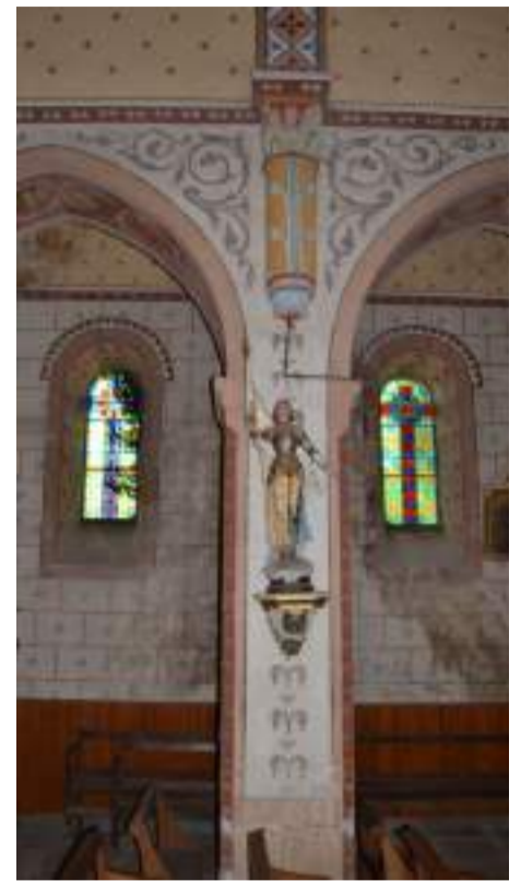
Deux rangées de cinq colonnes, portant chacune un chapiteau séparent la nef des bas côtés, comprenant neuf baies vitrées.

Voûte en berceau brisé avec des arcs doubleaux s'appuyant sur des chapiteaux et dix colonnes. L'ensemble couvert d'enduit peint pseudo-roman du 19ème Siècle.