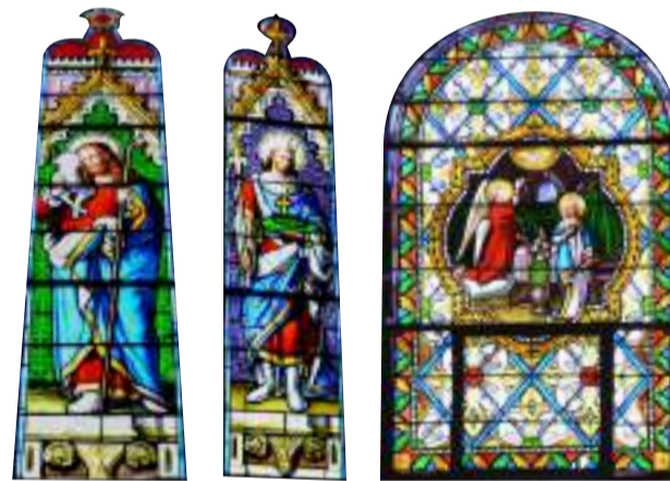
Deux des cinq vitraux de l'abside. Vitrail chapelle de la Sainte Vierge: la scène est pratiquement identique à celle du chœur Nord de Montboissier. Trois fenêtres au dessus du portail ouest apportent un peu de clarté.

Voûte en berceau brisé avec des arcs doubleaux s'appuyant sur des chapiteaux et dix colonnes. L'ensemble couvert d'enduit peint pseudo-roman du 19ème Siècle.