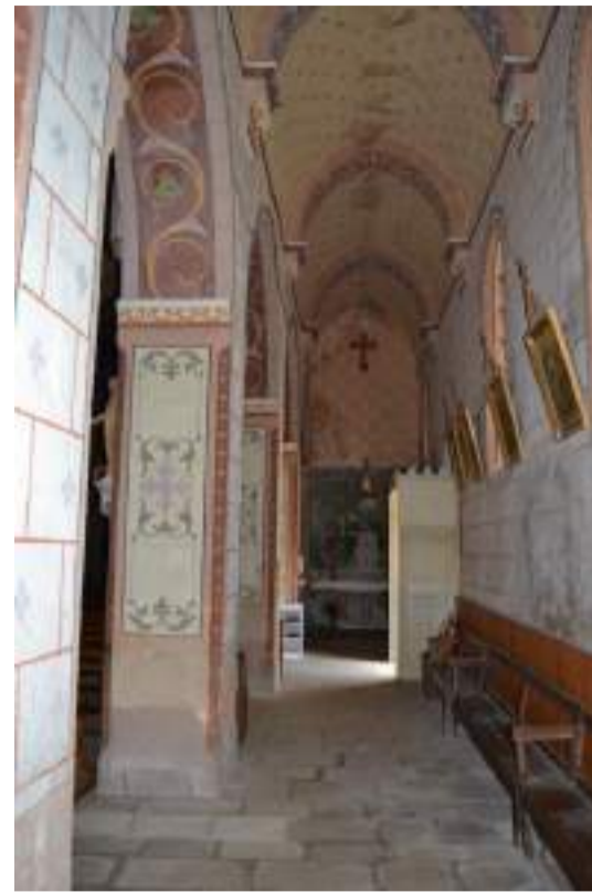
Bas côtés, voûte en berceau brisé de style gothique, agrémentés aux extrémités côté chœur d'autels.