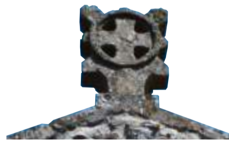
Croix celtique sur façade Ouest, peut être une fantaisie de l'architecte.